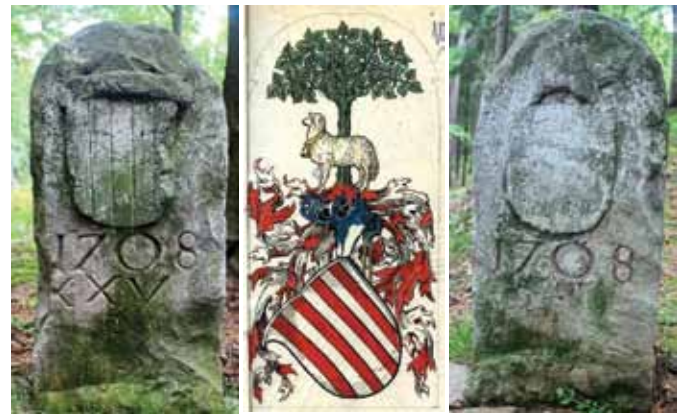
Schaffgotsch-Wappen Herb rodu Schaffgotsch

Es gab immer wieder Befragungen über diese Waldgrenze, so 1647, 1689, 1690, 1691, 1692, 1693. Eine gemalte „Spittelwaldes Mappæ von 1692“ gibt mit einge-