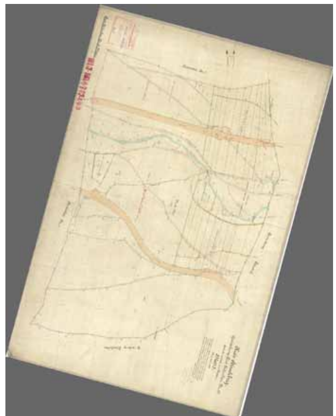
Mönchwald Flurkarte, Archiv Jelenia Góra Mapa katastralna Mniszego Lasu, archiwum Jelenia Góra