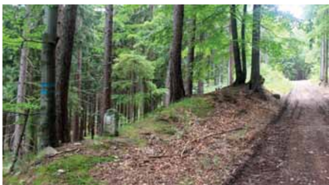
Grenzstein № 25 im Mönchwald am Fahrweg Kamień graniczny № 25 przy drodze w Mniszym Lesie.

Ein Eintrag im Messtischblatt bezeichnet das Flurstück als „Mönchwald“, so dass die geschichtlichen Zusammenhänge für alle Beteiligten deutlich wurden. Marcin Wawrzyńczak sandte mir im Sommer Fotos von diesem und zwei weiteren Grenzsteinen, die inzwischen gefunden worden waren, mit der Bitte um weitere Informationen. Meine Recherchen vor über 20 Jahren im Schaffgotsch-Archiv, Dokumente im Archivum Państwowe we Wrocławiu/Staatsarchiv Breslau und im Bestand der Akten über das